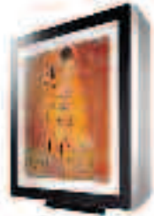
LG AirCool Innengerät mit Hi-C-Waeresehalter