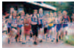
- Laufen -

* "Freiluftsaison" von den Osterferien bis zu den Herbstferien im Hülsta-Sportpark