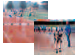
- Springen -